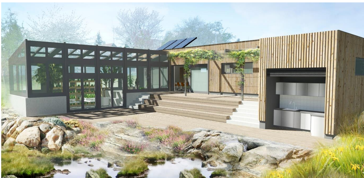
Plánovaná etapa budovaného školního arboreta – čeká se na grantovou výzvu