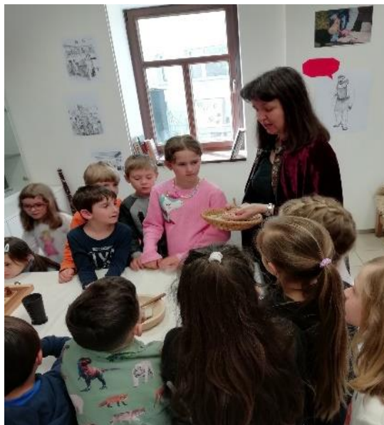
Foto.Spolupráce s Muzeem Říčany

Pro oblasti zaměřené na diferenciaci učiva a sebehodnocení žáků jsme po covidové době konečně mohli připravit pro sbor DVPP – realizováno bude v říjnu 2022.