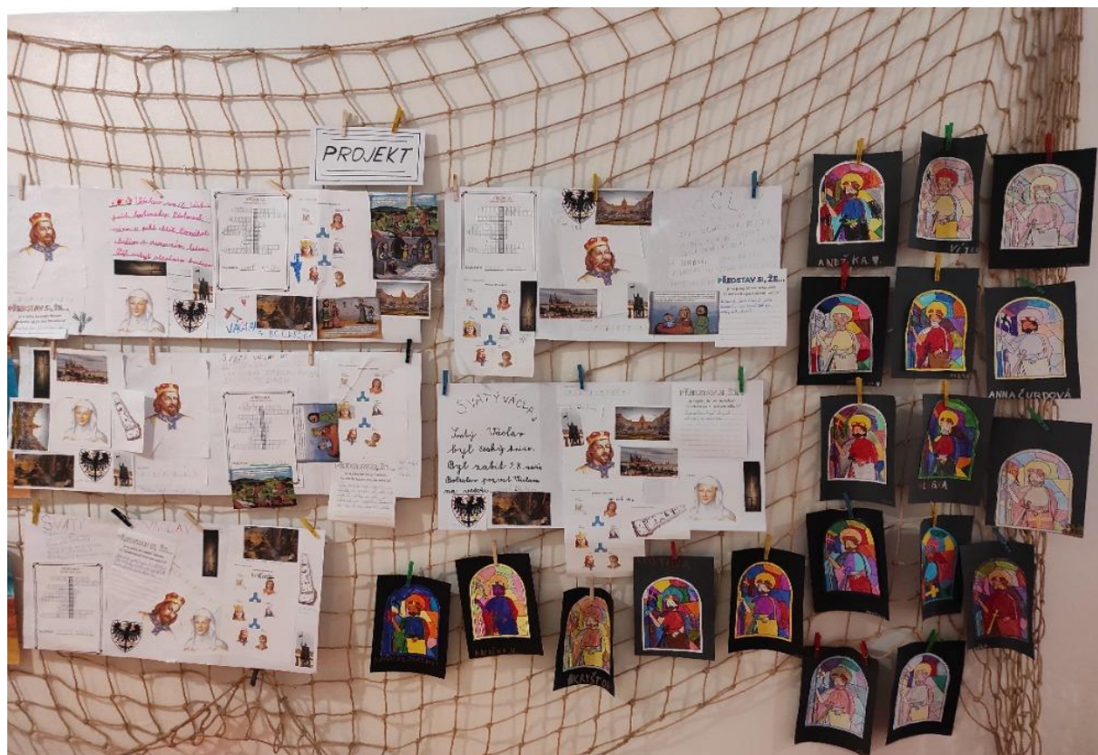
Foto: Prostředí školních chodeb

Školní poradenské pracoviště se věnuje žákům se speciálními vzdělávacími potřebami vč. žáků nadaných, prevenci patologických jevů, péči o žáky se vzdělávacími nebo výchovnými problémy a zaměření žáků na další studium nebo výběr povolání.