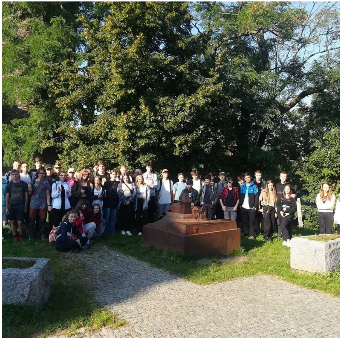
Foto: Setkávání se je důležité

Do programu školy významněji zasáhla inkluze. Ve škole je individuálně podpořeno na 100 žáků, ve třídách pracují asistenti pedagoga, v současné době jich ve škole máme 5. Školní poradenské pracoviště jsme museli rozšířit. Pracují v něm vedle metodika prevence a školního psychologa nyní dva výchovní poradci a kariérní poradkyně.